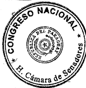
Fernando Lugo Méndez Presidente H. Cámara de Senadores

Handwritten signature of Fernando Lugo Méndez in black ink.